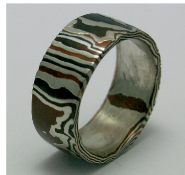
Ring von Raimund Schäffler