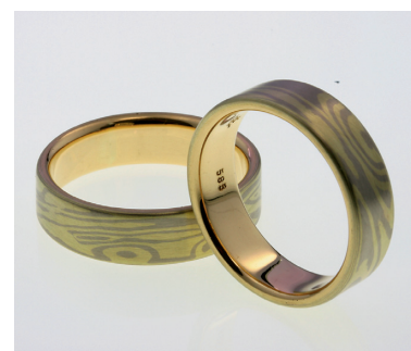
Ringe von Eileen Rogge und Elke Sperling