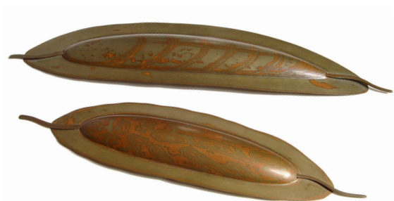
»Sheatfish«, Broschen von Birgit Laken aus Kupfer und Shibuichi