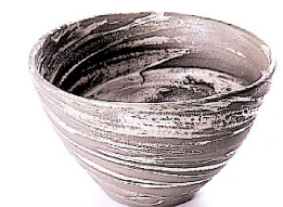
Objektschale von Sebastian Scheid

Gepackt in Mengen zu je 50 g Bestell-Nr. 6326