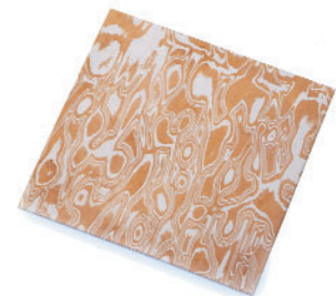
Mokume-gane Bleche sind das Ausgangsmaterial für Unikate mit individueller Struktur.

C. Hafner bietet die fertigen Bleche „Jazz“ und „Random“ (Bild li. und re.) sowie vorgefertigte Blöcke (Bild Mitte)