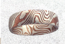
Ring: schmuck-schmiede.ch, Hansruedi Spillmann