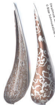
Ovaleschmuck-schmuck-schmiede.ch, Hansruedi Spillmann